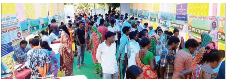
पोटका के शिविर में उमड़ी लाभुकों की भीड़