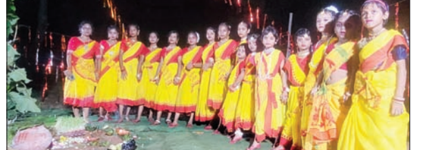
करम वर्ग पर नृत्य करती बच्चियां व युवतियां