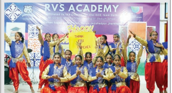
सांस्कृतिक नृत्य प्रस्तुत करती छात्राएं