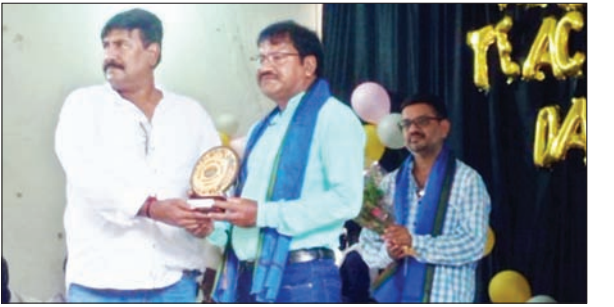
आयोग के सदस्य को सम्मानित करते प्रबंध समिति के सदस्य

अल्पसंख्यक आयोग के सदस्य को बांग्ला पाठ्यक्रम की बताई समस्या