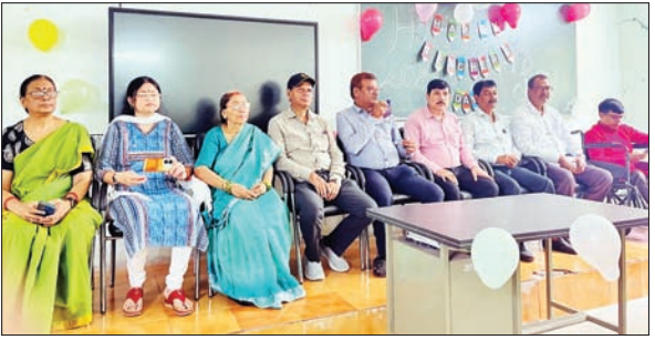
को-ऑपरेटिव कॉलेज में छात्रों को संबोधित करते शिक्षक

जमशेदपुर को-ऑपरेटिव कॉलेज में प्रोत्साहित किए गए मेधावी छात्र