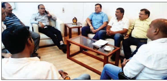
बैठक में शामिल कंपनी पदाधिकारी व समिति के लोग

टाटा स्टील यूआईएसएल (पूर्व नाम जुस्को) के महाप्रबंधक एवं जमशेदपुर दुर्गा पूजा केंद्रीय समिति के प्रतिनिधियों की बैठक में दुर्गा पूजा समितियों ने कंपनी से रियायती दर पर बिजली उपलब्ध कराने का आग्रह किया। कंपनी प्रबंधन से जिन प्रमुख समस्याओं पर चर्चा हुई, उसमें पंडाल निर्माण स्थलों में पेट्टों की छटाई, पूजा स्थलों पर सुगमता पूर्ण कार्य को संपादित करने के लिए स्लैब की आवश्यकता, पूजा समितियों के पूजा स्थल पर पार्क बनने के कारण पूजा स्थल समाप्त हो गई है, इसलिए वैकल्पिक स्थल अतिरिक्त प्रदान किया जाए। पूजा समितियों द्वारा यह पर्व अनुदान