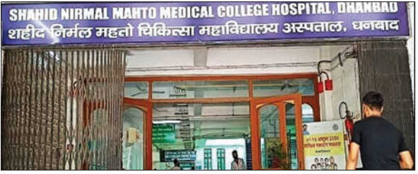
मेडिकल कॉलेज की फाइल फोटो