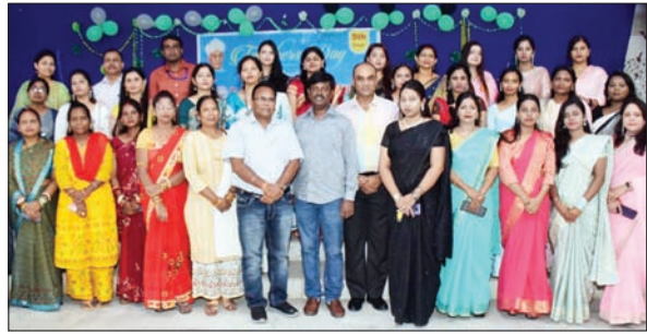
सीपी समिति स्कूल में उपस्थित शिक्षक व छात्र

सीपी समिति मध्य विद्यालय के बच्चों ने किया नाटक का मंचन, बटोरी तालियां