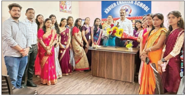
जेवियर स्कूल में शिक्षकों को सम्मानित करती छात्राएं

जेवियर इंग्लिश स्कूल के छात्र-छात्राओं ने शिक्षकों के योगदान को सराहा