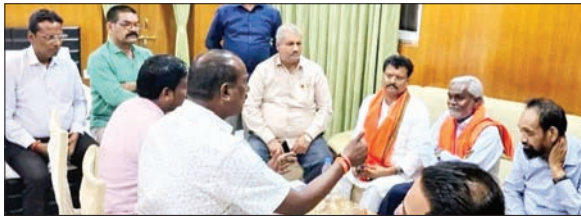
परिस्टन में बैठक करते भाजपा कार्यकर्ता