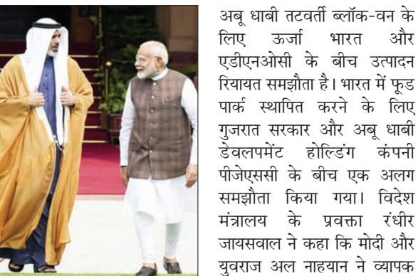
शेख खालिद व पीएम नरेन्द्र मोदी

NEW DELHI (BHASHA) : प्रधानमंत्री नरेन्द्र मोदी ने अबू धाबी के वली अहद (युवराज) शेख खालिद बिन मोहम्मद बिन जायद अल नाहयान के साथ व्यापक वार्ता की तथा दोनों देशों ने समग्र रणनीतिक संबंधों को बढ़ावा देने पर ध्यान केंद्रित करते हुए ऊर्जा सहयोग बढ़ाने के लिए सोमवार को चार समझौतों पर हस्ताक्षर किए। अबू धाबी नेशनल ऑयल कंपनी (एडीएनओसी) और इंडियन ऑयल कॉरपोरेशन लिमिटेड के बीच दीर्घकालिक एलएनजी आपूर्ति के लिए एक समझौता और एडीएनओसी और इंडिया स्ट्रैटेजिक प्रोटेक्टिव रिजर्व लिमिटेड (आईएसपीआरएल) के बीच एक समझौता चार समझौतों में शामिल हैं। विदेश मंत्रालय के अनुसार, अमीरात परमाणु ऊर्जा