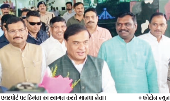
एयरपोर्ट पर हिमंता का स्वागत करते भाजपा नेता।