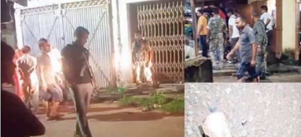
घटनास्थल पर खानबीन करती पुलिस व स्कोआ (इन्सेट में)।