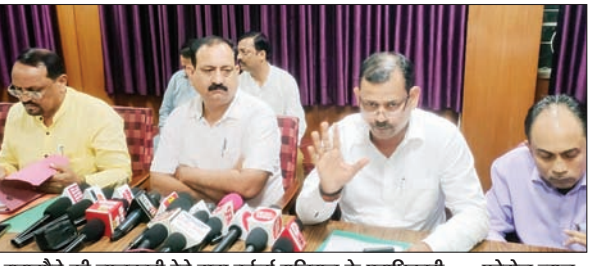
समझौते की जानकारी देते टाटा वर्कर्स यूनियन के पदाधिकारी