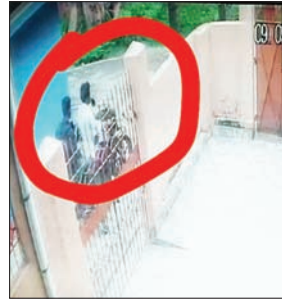
छिनतई का सीसीटीवी फुटेज

सुबह 7 बजे अन्य तीन महिलाओं के साथ घर लौट रही थी, तभी पीछे से एक बाइक पर सवार दो युवक गुजरे। आगे जाकर बाइक रुकी और वह वापस आने लगी। इसी बीच बाइक पर पीछे बैठे युवक ने गले से सोने की चेन छीनी और फरार हो गए। महिला ने बताया कि बाइक चला रहे युवक ने हेलमेट पहन रखा था,