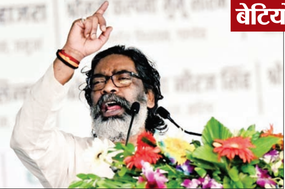
एम का संबोधित करते सीएम हेमंत सोरेन

PHOTON NEWS GIDIRIH : मुख्यमंत्री हेमंत सोरेन ने कहा कि गिरिडीह जिले में चार लाख महिलाओं को मुख्यमंत्री मईयां सम्मान योजना का लाभ दिया जा रहा है। अब 18 से 20 वर्ष की बेटियों को भी इस योजना का लाभ मिलेगा। अपनी बेटियों को गुरुजी स्टूडेंट क्रेडिट कार्ड के जरिए 15 लाख तक का ऋण लेकर उच्च शिक्षा दिलाएँ। आपकी सरकार झारखंड के मूलवासियों और आदिवासियों की सरकार है। सरकार बनने के बाद कई चुनौतियों से लड़ने के बाद हम इस मुकाम तक पहुंचे हैं। पहले विचौलियों के माध्यम से पेंशन