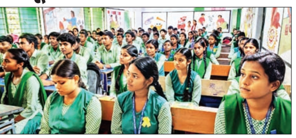
पटमदा में विशेषज्ञों की बात सुनते छात्र