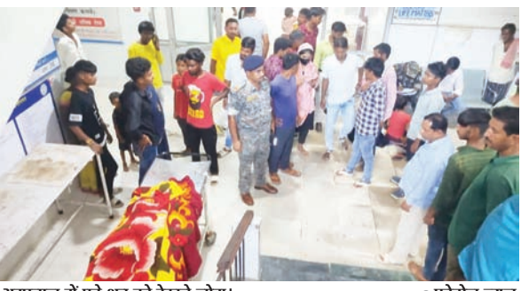
अस्पताल में पड़े शव को देखते लोग।

PHOTON NEWS PALAMU : जिले में एक शख्स ने अपनी पत्नी की धारदार हथियार से गला काटकर हत्या कर दी। घटना को अंजाम देने के बाद पति मौके पर से फरार हो गया। घटना की जानकारी मिलने के बाद पुलिस मौके पर पहुंची और शव को कब्जे में लेकर पोस्टमार्टम के लिए भेज दिया।