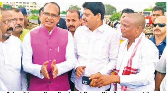
पार्टी नेताओं के साथ विचार-विमर्श करते शिवराज सिंह चौहान।