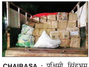
चाईबासा में नकली शराब फैक्ट्री का भंडाफोड़

CHAIBASA : पश्चिमी सिंहभूम जिला पुलिस ने सोमवार को एक नकली शराब फैक्ट्री का भंडाफोड़ किया है। पुलिस ने मुफ्फसिल थाना अंतर्गत पंडराशाली ओपी क्षेत्र के एक घर में छापेमारी कर 118 पेट्टी नकली शराब समेत नकली शराब बनाने की सामग्री जब्त की है। इसके साथ ही साथ मकान मालकिन समेत नकली शराब फैक्ट्री को भी पुलिस ने गिरफ्तार किया है। पुलिस को गुप्त सूचना मिली थी कि छोटा कुदाबड़ा गांव में अवैध रूप से अंग्रेजी शराब बनाई और बेची जा रही है।