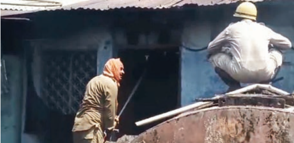
आग बुझाते दमकलकर्मी।

PHOTON NEWS DEOGHAR : देवघर के टेकर स्टैंड स्थित बने साबुन फैक्ट्री में भीषण आग लग गई। आग लगने की वजह से आसपास के इलाके में अफरा-तफरी का माहौल हो गया। घंटों की मशकत के बाद आग पर काबू पाया गया। अगलगी में लाखों का नुकसान हुआ है।