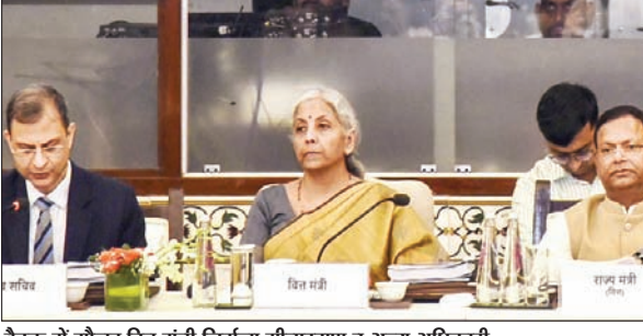
बैठक में मौजूद वित्त मंत्री निर्मला सीतारमण व अन्य अधिकारी

NEW DELHI (BHASHA) : जीएसटी परिषद स्वास्थ्य और जीवन बीमा प्रीमियम पर जीएसटी की दर को मौजूद 18 प्रतिशत से कम करने पर व्यापक रूप से सहमत हो गई है लेकिन इस पर अंतिम फैसला अगली बैठक में लिया जाएगा। सूत्रों ने यह जानकारी दी। कर दर को युक्तिसंगत बनाने की केंद्र और राज्यों के कर अधिकारियों की समिति (फिटमेंट कमेटी) ने सोमवार को जीएसटी परिषद के समक्ष एक रिपोर्ट पेश की। इसमें जीवन, स्वास्थ्य और पुनर्बीमा प्रीमियम पर जीएसटी कटौती के आकड़े और विक्षेपण दिए गए हैं। एक सूत्र ने कहा, 'स्वास्थ्य और जीवन बीमा पर जीएसटी दर में