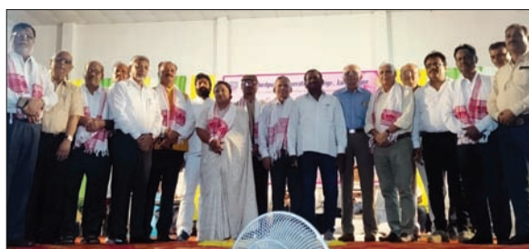
गंध पर मौजूद मंत्री, अतिथि व शिक्षक

सबसे पहले जमशेदपुर को-ऑपरेटिव कॉलेज के संबंध में चर्चा की। चूंकि वह भी इस कॉलेज के छात्र रहे हैं, इसलिए आज शिक्षा मंत्री के रूप में यहां मुख्य अतिथि के रूप में यादगार अनुभव साझा किया। लॉ कॉलेज अलग होगा : अपने संबोधन के क्रम में मंत्री ने कहा कि जमशेदपुर को-ऑपरेटिव लॉ कॉलेज की सारी व्यवस्था अलग होगी। इस कॉलेज का विस्तार और भवन निर्माण भी होगा। इसके लिए डीपीआर तैयार है। जल्द ही कार्य आरंभ होगा। उन्होंने कहा कि वह मंत्री पूरे राज्य के लिए हैं, लेकिन को-ऑपरेटिव कॉलेज का कोई भी कार्य विभाग में एक दिन भी नहीं रुकेगा। जो भी फाइल आएगी, अविलंब निष्पादन किया जाएगा।