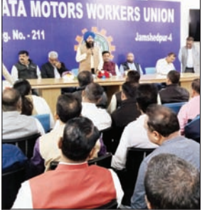
ATA MOTORS WORKERS UNION