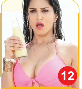
Sunny Leone's Hydrabad...