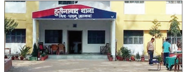
हुसैनाबाद थाना के बाहर पहुंचे परिजन

जिले के हुसैनाबाद थाना क्षेत्र में एक युवक ने किशोरी के साथ दुष्कर्म की घटना को अंजाम दिया है। वहीं, वारदात के बाद से किशोरी की हालत गंभीर है। मंगलवार को उसे सदर अस्पताल मेदिनीनगर रेफर कर दिया गया है। घटना की जानकारी मिलते ही पुलिस ने पीड़िता का बयान दर्ज कराया। जानकारी के अनुसार, आरोपी ने खेत में घटना को अंजाम दिया है। घटना की जानकारी मिलते ही पुलिस ने पीड़िता का बयान दर्ज कराया। जानकारी के अनुसार, आरोपी ने खेत में घटना को अंजाम दिया है। घटना की जानकारी मिलते ही पुलिस ने पीड़िता का बयान दर्ज कराया।