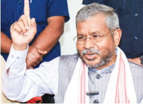
इसके कारण भ्रष्टाचार से संबंधित मामलों की सुनवाई ठप हो गई है। राज्य मानवाधिकार आयोग भी पूरी तरह से बंद है। मानवाधिकारों की रक्षा के लिए बनाए गए इस आयोग में पिछले लंबे समय से अध्यक्ष और सदस्य नहीं हैं, जिससे लोग मानवाधिकार उल्लंघन के मामलों में न्याय पाने से वंचित हो रहे हैं। राज्य महिला आयोग की स्थिति भी बेहद खराब है।

PHOTON NEWS RANCHI : बीजेपी के प्रदेश अध्यक्ष बाबूलाल मरांडी ने कहा है कि संवैधानिक संस्थाओं में खाली पदों के कारण आम जनता को न्याय नहीं मिल पा रहा। उन्होंने सोशल मीडिया पोस्ट में जिक्र करते हुए लिखा है कि राज्य में लोकतंत्र, सूचना आयोग और मानवाधिकार आयोग जैसे महत्वपूर्ण संस्थानों में लंबे समय से पद खाली हैं, जिससे लोगों की अर्जियों पर सुनवाई नहीं हो रही। बाबूलाल ने लिखा है कि लोकतंत्र कार्यालय में 2000 से अधिक मामले लंबित हैं। पूर्व लोकतंत्र जस्टिस डीएन उपाध्याय का कार्यकाल जून 2021 में समाप्त हो गया और तब से यह पद खाली है।