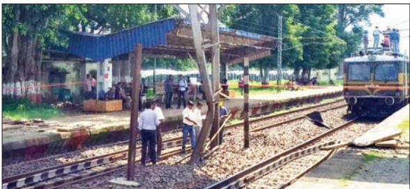
इन ट्रेनों का नहीं हुआ परिचालन

चक्रधरपुर रेल मंडल में रेल अधिकारियों की लापरवाही का खामियाजा रेल यात्रियों को भुगतना पड़ रहा है। रेलवे ने ट्रेन चलाने के नाम पर रेल यात्रियों को अब धोखा भी देना शुरू कर दिया है। ऐसा ही एक मामला चक्रधरपुर रेल मंडल में देखने को मिला है। चक्रधरपुर रेल मंडल के सोनुआ और चक्रधरपुर रेलवे स्टेशन में फुटओवर ब्रिज निर्माण कार्य को लेकर मंगलवार को पांच घंटे का मेगा ब्लॉक लेने की घोषणा की गई थी। इसके लिए रेलवे ने आठ महत्वपूर्ण यात्री ट्रेनों का परिचालन मंगलवार को रद्द कर दिया था, लेकिन हैरत की बात यह है कि मंगलवार को न तो फुटओवर ब्रिज निर्माण कार्य के लिए किसी ट्रेन का कोई कार्य हुआ, ना किसी प्रकार का मेगा ब्लॉक लिया गया।