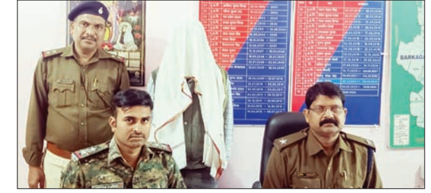
मांगले की जानकारी देते पुलिस पदाधिकारी