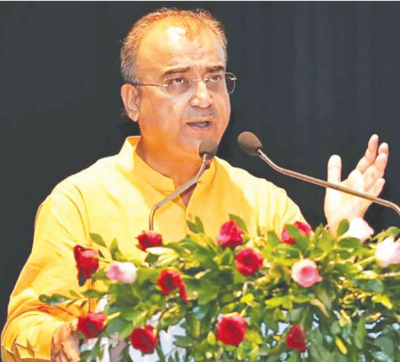
कृषि मंत्री मंगल पांडेय।

कृषि विभाग में तीन हजार पदों पर नियुक्ति होगी। विभाग इसकी तैयारी में जुट गया है। इनमें से एक हजार पदों पर नियुक्ति की प्रक्रिया अंतिम चरण में हैं, जबकि शेष दो हजार पदों पर नियुक्ति को लेकर विभाग में मंथन जारी है। शीघ्र ही इनके लिए भी विज्ञापन निकाला जाएगा। यह जानकारी कृषि मंत्री मंगल पांडेय ने दी। वह सोमवार को कृषि भवन सभागार में कृषि विभाग के 28 सहायक निदेशक स्तर के पदाधिकारियों को नियुक्ति पत्र देने के बाद समारोह को संबोधित कर रहे थे।उन्होंने कहा कि विभाग में जितने भी सृजित पद है, सभी पर नियुक्ति होगी। कोई पद रिक्त नहीं रहेगा। चरणबद्ध तरीके से सभी पर नियुक्ति की जाएगी। आज कृषि विभाग के बिहार कृषि सेवा कोटि-2 (कृषि अभियंत्रण) संवर्ग के 19 सहायक निदेशक