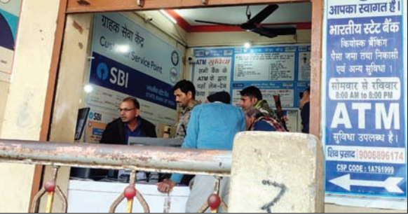
घटनास्थल पर जांच करते पुलिस पदाधिकारी