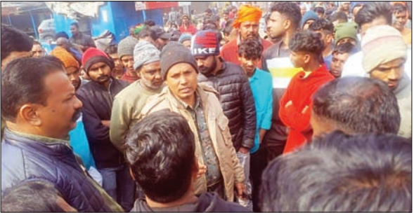
घटना के बाद बस स्टैंड पर लगी मौड़