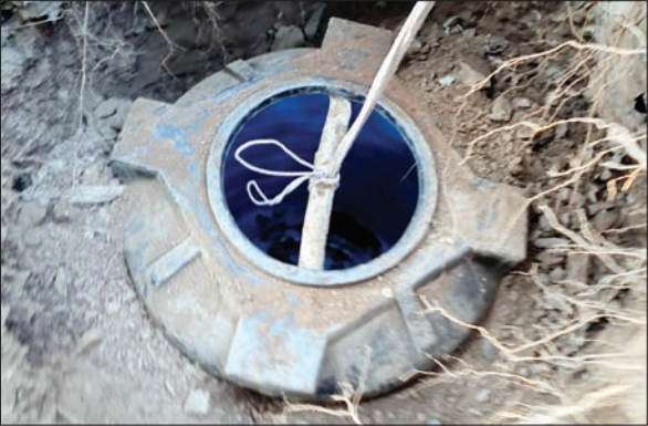
जमीन में दबाकर रखी गई पानी की टंकी

यहां जमीन के अंदर दबा कर रखी पानी की प्लास्टिक टंकी मिली, जिसमें नक्सलियों ने वांकी-टॉकी व विस्फोटक निर्माण सहित दैनिक उपयोग की सामग्री भी रखी थी। बता दें कि 10 अक्टूबर 2023 से पुलिस और सुरक्षा बल द्वारा संयुक्त अभियान चलाया जा रहा है। इसमें गोईलकेरा थानातर्गत ग्राम कुईड़ा, छोटा कुईड़ा, मारादिरि, मेरालगड़ा, हाथीबुरू, तिलायबेड़ा बोयपाईसांग, कटम्बा, बायहातु,