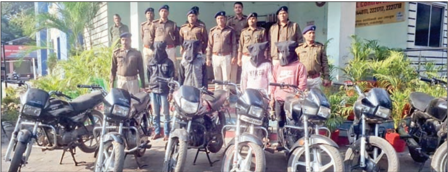
साकची थाना में बरामद बाइक के साथ आरोपी व पुलिसकर्मी