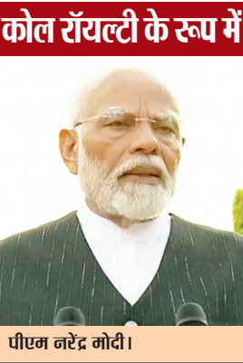
पीएम नरेंद्र मोदी।

झारखंड में विधानसभा चुनाव से पहले ही कोल रॉयल्टी व अन्य मद के रूप में केंद्र पर राज्य के 1.36 लाख करोड़ रुपये बकाया का मामला हेमंत सोरेन ने जोर-जोर से उठाया था। चुनाव में जीतने और मुख्यमंत्री पद की शपथ लेने के के बाद भी उन्होंने इस मुद्दे की चर्चा जारी रखी। स्थिति वहां तक सामने आ गई कि राज्य सरकार की ओर से कहा गया कि बकाया वापस लेने के लिए कानूनी कार्रवाई भी की जा सकती है। वर्तमान समय में राज्य में बजट पूर्व चर्चा हो रही है। 3 फरवरी को विधानसभा में