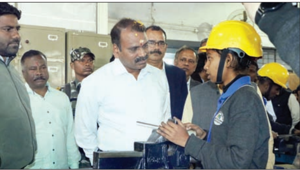
मजदूर से बात करते केंद्रीय राज्य मंत्री डॉ. एल मुरुगन