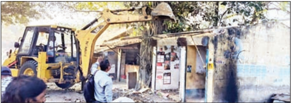
दुकान तोड़ता बुलडोजर

चक्रधरपुर रेल मंडल मुख्यालय में शुक्रवार को अचानक रेलवे स्टेशन के सामने दुकानदारों पर बुलडोजर चलाया शुरू हो गया। यह देख दुकानदारों में हड़कंप मच गया। अचानक सुबह में घोषणा की गई और कुछ घंटे बाद दो पोक्लेन मशीन लगाकर तेजी से दुकानों और निर्माण के ढांचों को गिराना शुरू कर दिया गया। देर शाम तक 38 में से करीब चार दुकानों को जमींदोज कर दिया गया। शाम को फिर घोषणा की गई की रात भर में सभी दुकानदार अपनी दुकानों को खाली कर लें, अन्यथा 18 जनवरी को सभी दुकानों को तोड़कर हटा दिया जाएगा। जानकारी के मुताबिक, शुक्रवार सुबह अचानक इंजीनियरिंग विभाग