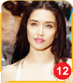
Shraddha Kapoor Twins With Her...