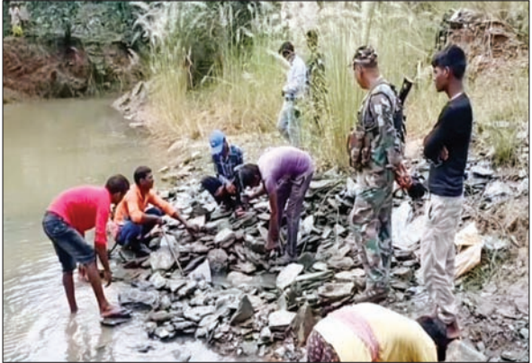
नदी तट से मिट्टी व पत्थर निकालते लोग