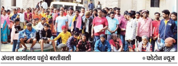
अंचल कार्यालय पहुंचे बस्तीवासी

रेगड़ा, पाटातोरब, गोबुरू, लुईया के सीमावर्ती क्षेत्र में प्रारंभ किया गया है।