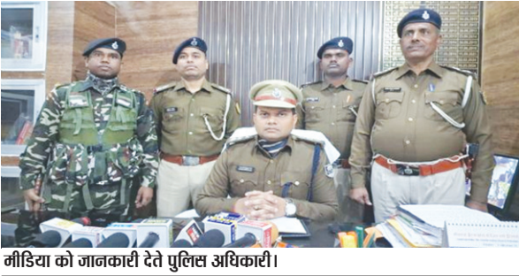
मीडिया को जानकारी देते पुलिस अधिकारी।