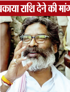
सीएम हेमंत सोरेन।

राज्य का बजट पेश किया जाना है। इस बीच यह महत्वपूर्ण खबर सामने आई है कि केंद्र सरकार ने राज्य से 13299