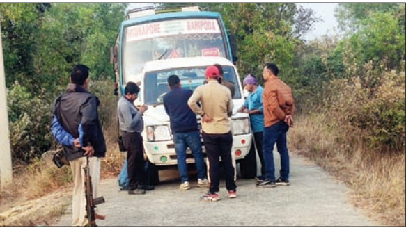
बस की जांच करते पुलिस पदाधिकारी

शुक्रवार को जब बस बारीपदा से मेदिनीपुर के लिए चली, तब पुलिस को गुप्त सूचना मिली कि बस से गांजा की तस्करी हो रही है। इसी के मद्देनजर बड़सोल पुलिस थाना के सामने चेकनाका लगाकर जांच पड़ताल करने के