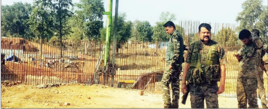
घटनास्थल पर जांच के लिए पहुंचे पुलिस पदाधिकारी व जवान