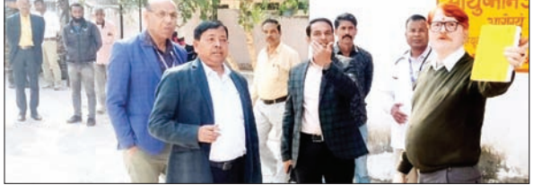
कॉलेज भवन का निरीक्षण करते पहुंचे पदाधिकारी

PALAMU : स्वास्थ्य चिकित्सा शिक्षा एवं परिवार कल्याण विभाग के अपर मुख्य सचिव द्वारा दिये गये निर्देशों के आलोक में एमएमसीएच के जीएनएम कॉलेज के भवन में विभिन्न ओपीडी शिफ्टिंग व कंडम भवनों को ध्वस्त करने का कार्य किया जा रहा है। इस कार्य की प्रगति एवं मूल्यांकन करने हेतु पलामू उपायुक्त द्वारा टीम गठित किया गया है। इसी टीम के जरिये बुधवार को एमएमसीएच में किये जा रहे शिफ्टिंग एवं डिमोलिश कार्यों का निरीक्षण किया गया।