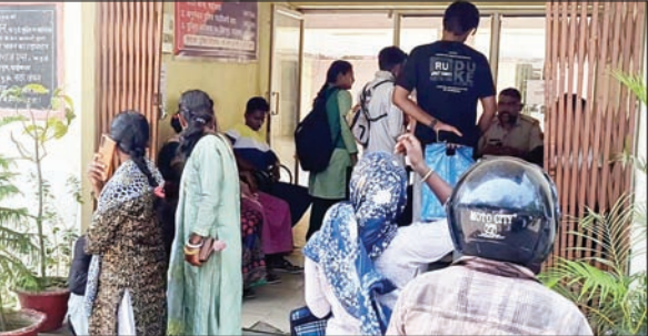
घाने में जुटी लोगों की भीड़