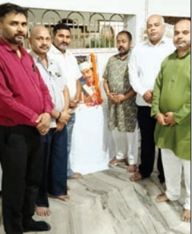
श्रद्धांजलि समारोह में उपस्थित लोग