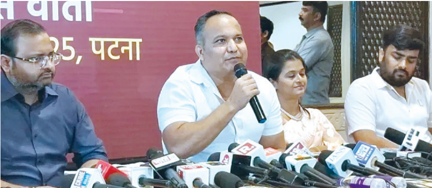
पेस को संबोधित करते पूर्व आईपीएस अधिकारी शिवदीप लांडे व अन्य

AGENCY PATNA : बिहार में विधानसभा चुनाव होने से पूर्व बिहार के सुपर कॉप कहे जाने वाले पूर्व आईपीएस अधिकारी शिवदीप लांडे ने आखिरकार राजनीति में अपना कदम रख दिया है। इसके लिए उन्होंने अपनी नई राजनीतिक पार्टी बनायी है जिसका नाम हिंद सेना रखा गया है। पार्टी के ऐलान के साथ शिवदीप लांडे ने यह भी ऐलान किया है कि उनकी पार्टी बिहार के 243 सीटों पर चुनाव लड़ेगी। शिवदीप लांडे ने मंगलवार को पटना में प्रेस कॉन्फ्रेंस कर कहा कि उनकी पार्टी बिहार में कास्ट फैक्टर से हटकर सभी धर्म जात के लोगों के लिए काम करेगी और