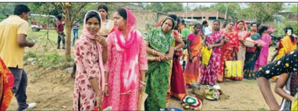
मंगला पूजा के लिए उपस्थित महिलाएं

आईडी की जेरोक्स मांगे जाने पर महिला ने कोई पहचान नहीं दी। लेकिन बाद में उसका आधार कार्ड लेकर उसे कमरे में ले जाकर आरोपी ने महिला के साथ जोर जबरदस्ती करनी शुरू कर दी। महिला ने खुद को असुरक्षित पाकर चिल्लाना शुरू किया और