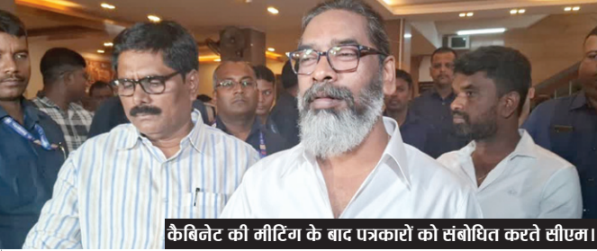
कैबिनेट की मीटिंग के बाद पत्रकारों को संबोधित करते सीएम।