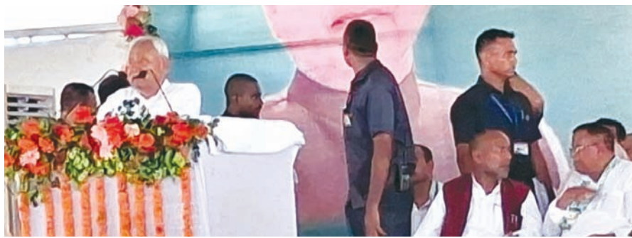
कार्यक्रम को संबोधित करते मुख्यमंत्री नीतीश कुमार

AGENCY PATNA : मुख्यमंत्री नीतीश कुमार ने जगजीवन स्टेडियम भभुआ में कैमूर जिला के राष्ट्रीय जनतांत्रिक गठबंधन (राजग) कार्यकर्ताओं के साथ आज आयोजित संवाद कार्यक्रम में कहा कि हमलोग बिहार के विकास में लगे हुए हैं। 2005 से पहले कैमूर जिला की स्थिति काफी दयनीय थी। अपराध चरम पर था, समाज में काफी विवाद होता था। हमलोगों ने यहां विकास के अनेक काम कराए हैं। अब शांति का माहौल कायम है। कानून का राज है। मुख्यमंत्री ने कहा कि कैमूर जिले में इंजीनियरिंग कॉलेज, पॉलिटेक्निक संस्थान, महिला आईटीआई, सभी अनुमंडलों में आईटीआई, जीएनएम संस्थान एवं पारा मेडिकल संस्थान की स्थापना की गई है। भभुआ में सदर अस्पताल का निर्माण कराया गया है। यहां अनुसूचित जाति/अनुसूचित जनजाति आवासीय विद्यालयों का निर्माण, कपुरी छात्रावास, बड़ी