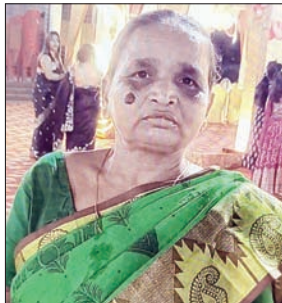
मृतक की फाइल फोटो