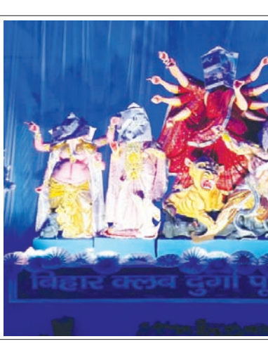
बिहार क्लब के पूजा पंडाल में मूर्तियों की साज-सज्जा