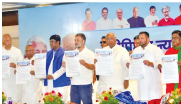
घोषणा पत्र जारी करते खड़गे, राहुल, तेजस्वी व अन्य

AGENCY PATNA : बिहार विधानसभा चुनाव-2025 के लिए महागठबंधन का घोषणा-पत्र (चुनावी मैनिफेस्टो) आना शुरू हो गया है। कांग्रेस नेता राहुल गांधी और राष्ट्रीय जनता दल (राजद) के नेता तेजस्वी यादव ने बुधवार को पटना में घोषणा पत्र का पहला भाग जारी किया। महागठबंधन की ओर से जारी घोषणा पत्र में अति पिछड़ा वर्ग (ईबीसी) के लिए पंचायत चुनाव और निकाय चुनाव में 30 फीसदी आरक्षण और एससी-एसटी की तरह अति पिछड़ा अत्याचार निवारण कानून बनाने के वादे किए गए हैं। इस मौके पर कांग्रेस सांसद और लोकसभा में नेता प्रतिपक्ष राहुल गांधी ने अपने संबोधन में कहा कि देश में अति पिछड़ा, आदिवासी, ओबीसी और