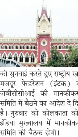
कोयला मजदूरों के बोनस पर बैठक होगी।