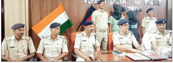
पत्रकारों को मामले की जानकारी देते पुलिस पदाधिकारी