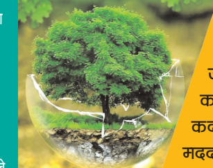
हिताधारकों के बीच विश्वास बढ़ाने की पहल

अभियोजित और अंधाधुंध विकास की वजह से गंभीर बन जाता है पर्यावरण संकट केंद्र सरकार ने व्यावसायिक गतिविधियों को सहजता से जारी रखने के लिए किया रिफॉर्म केंद्रीय वन एवं पर्यावरण मंत्रालय की ओर से जारी किया गया नया ऑडिट नियम 2025