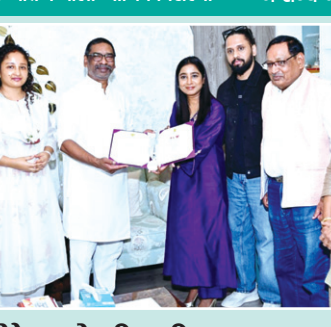
हेमंत सोरेन को गीत भी सुनाया

मुलाकात के दौरान शिल्पा राव ने अपनी जीवन यात्रा के बारे में मुख्यमंत्री हेमंत सोरेन को बताया। उन्होंने मुख्यमंत्री को बताया कि किस तरह उन्होंने सिंगिंग की दुनिया में कदम रखा और किस तरह बॉलीवुड में सचिव के बाद आज राष्ट्रीय पुरस्कार जीतने में कामयाब हुईं। उन्होंने अपने अनुभव भी सीएम सोरेन के साथ साझा किये। शिल्पा राव ने सीएम को गीत भी सुनाया।