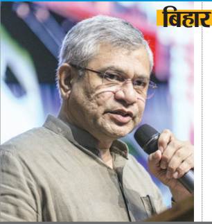
मंजूरी दी है। कैबिनेट के फैसले की जानकारी केंद्रीय सूचना एवं प्रसारण मंत्री अश्विनी वैष्णव ने दी।