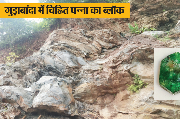
गुड़ाबांदा में चिह्नित पन्ना का ब्लॉक