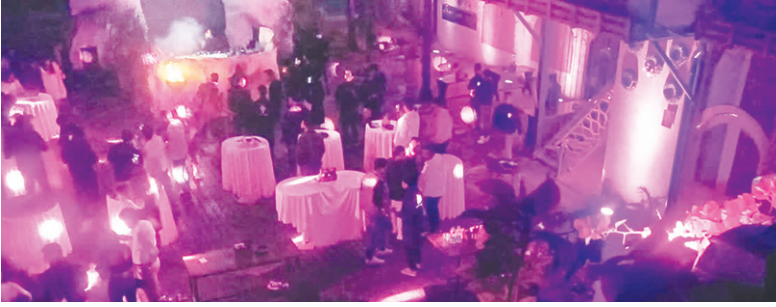
कार्यक्रम के पहले जमा करना होगा सेफ्टी प्लान

100 से अधिक लाइसेंसी बार और रेस्टोरेंट झारखंड सरकार ने भी पुलिस और प्रशासन को निर्देश दिया है कि बार, रेस्टोरेंट और क्लब में होने वाले इवेंट में सेफ्टी गाइडलाइंस का सख्ती से पालन किया जाए। उत्पाद विभाग के आधिकारिक आंकड़ों के अनुसार, रांची शहर में 100 से ज्यादा लाइसेंसी बार और रेस्टोरेंट हैं। इनमें से अधिकांश बार और रेस्टोरेंट वेस हैं, जो रूफटॉप है या कमर्शियल कॉम्प्लेक्स में स्थित हैं। रांची में लगभग एक दर्जन के करीब नाइटक्लब भी हैं, जिन्हें डिस्को क्लब कहा जाता है। ये डिस्को क्लब रांची के बड़े मॉल में हैं। इसके अलावा, एक दर्जन से ज्यादा क्लब और लगभग आधे दर्जन से ज्यादा ऐसे स्वतंत्र स्थान हैं, जहां नए साल का जश्न बड़े धूमधाम से मनाया जाता है।