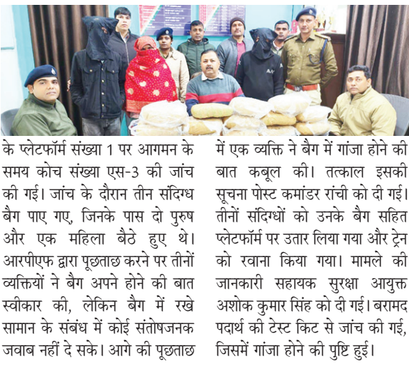
के प्लेटफॉर्म संख्या 1 पर आगमन के समय कोच संख्या एस-3 की जांच की गई। जांच के दौरान तीन संदिग्ध बैग पाए गए, जिनके पास दो पुरुष और एक महिला बैठे हुए थे। आरपीएफ द्वारा पूछताछ करने पर तीनों व्यक्तियों ने बैग अपने होने की बात स्वीकार की, लेकिन बैग में रखे सामान के संबंध में कोई संतोषजनक जवाब नहीं दे सके। आगे की पूछताछ