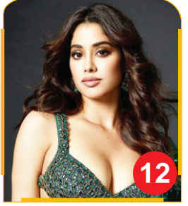
Janhvi Kapoor Masters The...