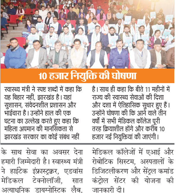
10 हजार नियुक्ति की घोषणा

स्वास्थ्य मंत्री ने स्पष्ट शब्दों में कहा कि यह विहार नहीं, झारखंड है। यहां सुशासन, सर्वेक्षण प्रशासन और भाईचारा है। उन्होंने हाल की एक घटना का उल्लेख करते हुए कहा कि महिला अपमान की मानसिकता से झारखंड सरकार का कोई संबंध नहीं है। साथ ही कहा कि बीते 11 महीनों में राज्य की स्वास्थ्य सेवाओं की दिशा और दशा में ऐतिहासिक सुधार हुए हैं। उन्होंने घोषणा की कि आने वाले तीन वर्षों में सभी मेडिकल कॉलेज पूरी तरह क्रियाशील होंगे और करीब 10 हजार नई नियुक्तियां की जाएगी।