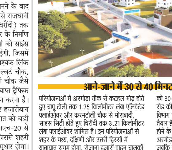
परियोजनाओं में अरगोडा चौक से कटहल मोड़ होते हुए चारू टोली तक 1.75 किलोमीटर लंबा एलिवेटेड फ्लाईओवर और करमटोली चौक से मोरहाबादी, साइंस सिटी होते हुए चिरौंदी तक 3.21 किलोमीटर लंबा फ्लाईओवर शामिल है। इन परियोजनाओं से शहर के मध्य, दक्षिणी और उत्तरी हिस्सों में यातायात सुगम होगा, रोजाना हजारों वाहन चालकों

परियोजना को सीएम हेमंत ने दी है स्वीकृति मुख्यमंत्री हेमंत सोरेन ने इस परियोजना को स्वीकृति प्रदान कर दी है, जिससे निकट भविष्य में रांची के नगरिकों को सुगम और निर्बाध आवागमन की सुविधा प्राप्त होने की आशा है। इस संबंध में इसी साल सितंबर माह में विभाग द्वारा तैयार प्रोजेक्शन को देखने के बाद मुख्यमंत्री ने अधिकारियों को अरगोडा चौक से कटहल मोड़ और करम टोली चौक से साइंस सिटी फ्लाईओवर निर्माण के लिए डीपीआर बनाने के लिए आगे की कार्य योजना को मूर्त रूप देने का निर्देश दिया था। बला दे कि पिछले कुछ महीनों में राजधानी रांची को सिरम टोली से मेहलौ, कोकर से बहूबाजार और राठ रोड पर प्लाईओवर बनने से बहुत हद तक ट्रैफिक लोड कम करने में मदद मिली है।