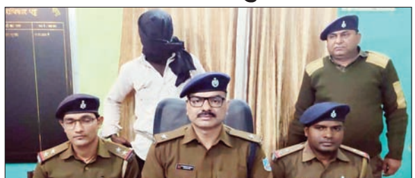
पत्रकारों को मामले की जानकारी देते पुलिस पदाधिकारी