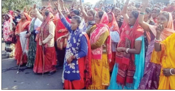
जादेबाजी करती महिलाएं

जिले के वेस्ट बोकारो क्षेत्र में केबीपीएल (ऋषय बायो प्युअल प्राइवेट लिमिटेड) कंपनी के खिलाफ ग्रामीणों का गुस्सा फूटा है। नौकरी और मुआवजे की मांग को लेकर लोगों ने कंपनी का काम ठप कर दिया है। गुरुवार को कंपनी के कर्मचारी काम करने के लिए माइंस एरिया में घुसने का प्रयास कर रहे थे। लेकिन ग्रामीणों के उग्र प्रदर्शन के कारण काम शुरू नहीं हो पाया इस बार गुस्साए ग्रामीणों को नेतृत्व राज्यसभा सांसद खीरू महतो कर रहे हैं। उन्होंने कहा कि परियोजना के नाम पर सीसीएल ने जमीन अधिग्रहण किया इसके बाद काम निजी कंपनी