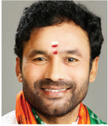
जी. किशन रेड्डी