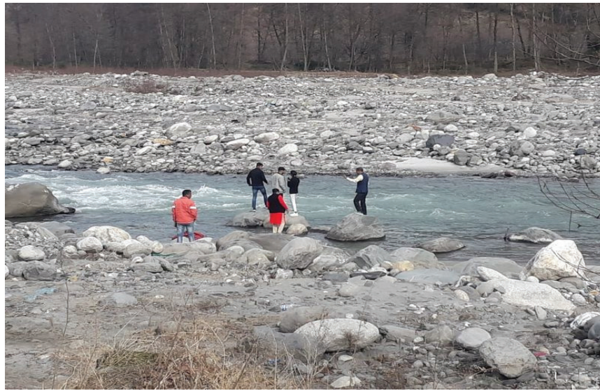
to support human weight. Tourism cannot be a free pass

REPEATED warnings and safety advisories are not having the desired effect as tourists continue to put their lives at great risk in Himachal Pradesh. Despite signposts prohibiting any such reckless activity, many continue to venture close to riverbeds or walk on frozen lakes. Patrolling has been intensified and fines are now being imposed in Lahaul & Spiti district. The authorities must crack the whip with hefty penalties, not token amounts, and mention in bold letters the consequences of indulging in grossly irresponsible behaviour. The death of two tourists in Arunachal Pradesh last week serves as a painful reminder of past tragedies in Himachal. Both drowned as the ice cracked while they were trying to rescue a member of their group who slipped into the frozen Sela Lake. The site has signboards prohibiting stepping onto the lake as the ice may be unstable and unable