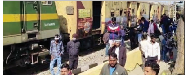
घटनास्थल पर लुटी गौड़

PHOTON NEWS DEOGHAR : देवघर जिले में गुरुवार की सुबह एक बड़ा रेल हादसा होत-होते टल गया। हावड़ा-झरखंडीमुख मार्ग पर रोहिणी नावाडीह फाटक के पास उस समय अफरातफरी मच गई, जब गोरखपुर-आसनसोल पैसंजर ट्रेन की एक ट्रक से जोरदार टक्कर हो गई। घटना ने रेलवे सुरक्षा व्यवस्था और फाटक संचालन को लेकर गंभीर सवाल खड़े कर दिए हैं। हादसे में दो बाइक सवार गंभीर रूप से घायल हुए हैं, जबकि रेल और सड़क यातायात कुछ समय के लिए पूरी तरह ठप हो गया। प्रत्यक्षदर्शियों और प्रारंभिक जानकारी के अनुसार, यह दुर्घटना उस समय हुई जब जसीडीह की ओर से आसनसोल का जही गोरखपुर-आसनसोल ट्रेन अपने निर्धारित मार्ग पर थी। उसी दौरान देवघर से देवीपुर की ओर जा रहा