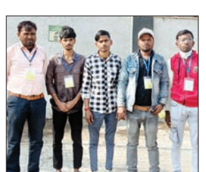
प्रशिक्षण के लिए गए किसान

खाद्य सुरक्षा मिशन (एनएफएसएम) के दलहन मिशन के तहत प्रशिक्षण के लिए भोपाल (मध्य प्रदेश) भेजे गए किसानों ने प्रशिक्षण व्यवस्था पर गंभीर सवाल खड़े किए हैं। किसानों का आरोप है कि एक दिन औपचारिक प्रशिक्षण करने के बाद उन्हें टूर प्रोग्राम में लगा दिया गया, जिससे प्रशिक्षण का मूल उद्देश्य ही भटक गया है। जानकारी के अनुसार, जिले के विभिन्न प्रखंडों से चयनित 48 किसानों को पांच दिवसीय प्रशिक्षण-सह-भ्रमण कार्यक्रम के तहत भोपाल भेजा जानवरी से प्रशिक्षण शुरू हुआ। किसानों को भोपाल के केंद्रीय कृषि अभियांत्रिकी संस्थान एवं भारतीय मृदा अनुसंधान संस्थान में भेजे जाने की पद्धतियों, उन्नत बीज, सिंचाई तकनीक, मिट्टी प्रबंधन, आधुनिक कृषि यंत्रों और