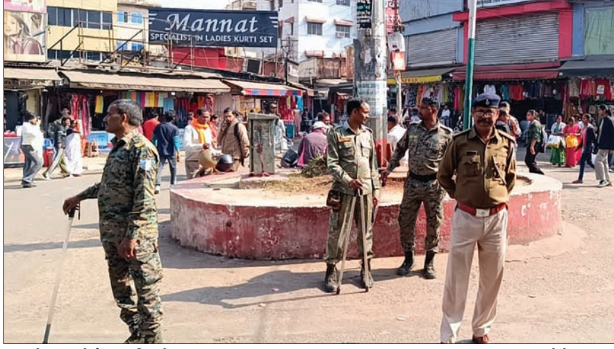
साकची बाजार में तैनात पुलिस के जवान

साकची बाजार में फुटपाथ दुकानें अब नहीं लगेंगी। दुकानदारों में आपसी मारपीट के बाद साकची थाना पुलिस ने यह फैसला लिया है। साकची बाजार में झंडा चौक और उसके आसपास पुलिस जवानों को तैनात कर दिया गया है। पुलिस के जवानों को निर्देश दिया गया है कि बाजार में कोई भी फुटपाथ दुकानदार दुकान नहीं लगाने पाए। पुलिस तैनात होने के बाद कई फुटपाथी दुकानदार यहां फुटपाथ दुकानें लगाने आए थे। मगर, पुलिस कर्मियों ने सबको मना कर दिया। पुलिस का कहना है कि किसी भी तरह की अनहोनी से बचने के लिए यह तैनाती की गई है। बताया जा रहा है कि फुटपाथ दुकान नहीं लगने से बाजार में भीड़ कम हो गई है। आवागमन सुचारू रूप से चल रहा है। दूसरी तरफ, फुटपाथ