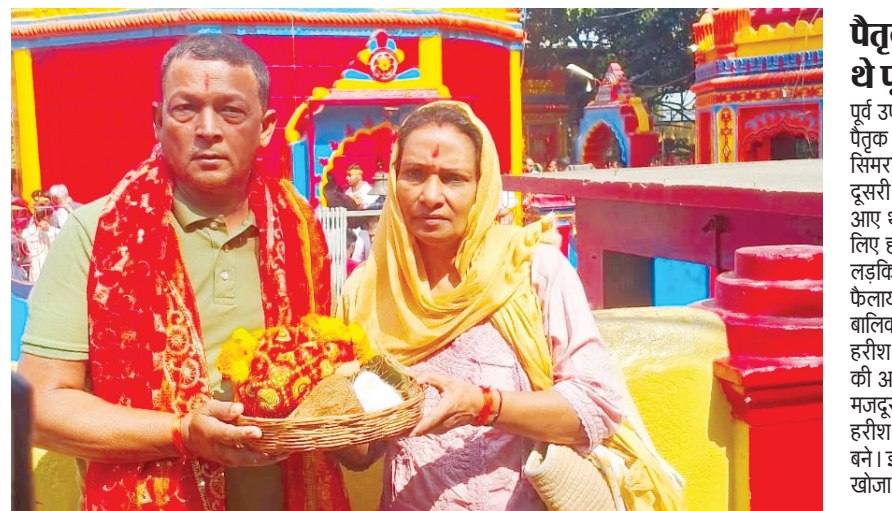
उन्होंने कहा कि हमारे पूर्वज