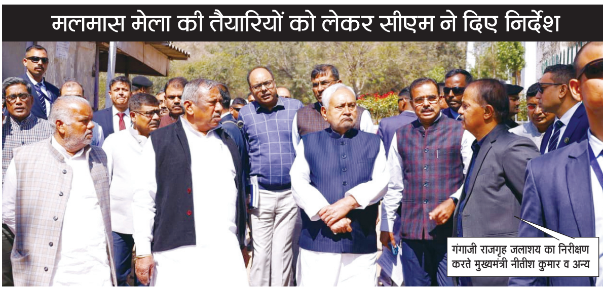
मलमास मेला की तैयारियों को लेकर सीएम ने दिए निर्देश

PHOTON NEWS PATNA : बिहार के मुख्यमंत्री नीतीश कुमार ने शनिवार को नवादा जिले के नारदीगंज अंचल स्थित मोतानाजे ग्राम के पास अवस्थित गंगाजी राजगृह जलाशय का निरीक्षण किया। उन्होंने जलाशय परिसर का भ्रमण कर वहां की व्यवस्थाओं का जायजा लिया और अधिकारियों को आवश्यक दिशानिर्देश दिए। मुख्यमंत्री ने इस अवसर पर कहा कि गंगाजी जल आपूर्ति योजना के तहत गयाजी, बोधगया, नवादा और राजगीर में लोगों को शुद्ध पेयजल उपलब्ध कराया जा रहा है। उन्होंने संबंधित विभागीय अधिकारियों को निर्देश दिया कि शुद्ध पानी की आपूर्ति निरंतर जारी रहे और इसमें किसी प्रकार की बाधा न आने पाए, इसका विशेष ध्यान रखना है। साथ ही जलाशय परिसर को स्वच्छ, व्यवस्थित और पर्यावरण के अनुकूल बनाए रखने पर जोर दिया। इसके बाद मुख्यमंत्री ने नालंदा जिले के राजगीर स्थित गुडकूट