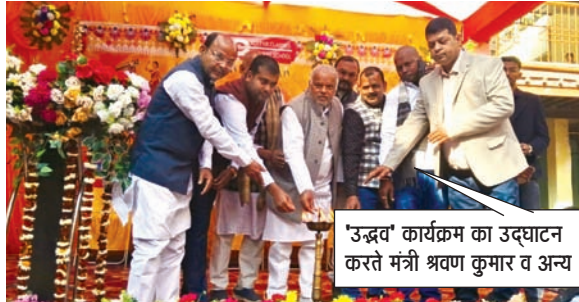
'उद्भव' कार्यक्रम का उद्घाटन करते मंत्री श्रवण कुमार व अन्य

AGENCY NALANDA : ग्रामीण विकास एवं परिवहन मंत्री श्रवण कुमार ने शनिवार को नूरसराय में आयोजित आदित्य कलासेज के द्वारा आयोजित 'उद्भव' कार्यक्रम का शुभारंभ किया गया। इस अवसर पर उन्होंने कहा कि दुनिया में लगाभग हर चीज बाजार में बिक सकती है, लेकिन ज्ञान कभी बाजार में नहीं बिकता। उन्होंने कहा कि समाज में उसी व्यक्ति का सम्मान होता है जो ज्ञानवान होता है। आज के प्रतिस्पर्धा के दौर में वही आगे बढ़ेगा जो अधिक से अधिक ज्ञान अर्जित करेगा। मंत्री ने कहा कि बिहार सरकार के नेतृत्व में शिक्षा व्यवस्था को मजबूत करने की दिशा में व्यापक कदम उठाए गए हैं। करीब 23 हजार नए सरकारी विद्यालय खोले गए। वर्तमान में राज्य में वर्ग एक से आठ तक