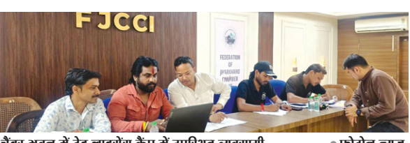
चेंबर भवन में ट्रेड लाइसेंस कैंप में उपस्थित व्यवसायी

PHOTON NEWS RANCHI : फेडरेशन ऑफ झारखंड चेंबर ऑफ कॉमर्स एंड इंडस्ट्रीज और रांची नगर निगम के संयुक्त तत्वावधान में मंगलवार को चेंबर भवन में ट्रेड लाइसेंस कैंप का आयोजन किया गया। इस कैंप के माध्यम से व्यापारियों को नया ट्रेड लाइसेंस बनवाने, पुराने लाइसेंस का नवीनीकरण कराने और होल्डिंग टैक्स जमा करने की सुविधा एक ही स्थान पर प्रदान की गई। कैंप में 25 से अधिक व्यापारियों ने नया ट्रेड लाइसेंस बनवाया और कई व्यापारियों ने अपने लाइसेंस का नवीनीकरण कराया। इसके अलावा, बड़ी