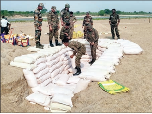
बंकर बनाने लैला के जवान