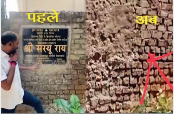
बोरिंग स्थल पर पहले लगाया गया शिलापट व बाद में हटाया गया

PHOTON NEWS JSR : मानगो नगर निगम के बालीगुमा स्थित सुकना बस्ती में एक निर्माणधीन अपार्टमेंट में विधायक निधि से बिल्डर की जमीन पर डीप बोरिंग कराए जाने का मामला मंगलवार को सामने आया। जैसे ही द फोटोन न्यूज ने इस अनियमितता का खुलासा किया, थोड़ी ही देर बाद निर्माणधीन अपार्टमेंट पहुंचे कुछ लोगों ने मौके से डीप बोरिंग के शिलान्यास व उद्घाटन वाले शिलापट को गायब कर दिया। सोमवार सुबह तक यह शिलापट मौजूद था। लेकिन जैसे ही इस गड़बड़ी की खबर चली बसे ही शिलापट को गायब कर दिया गया है। शिलापट गायब होने के बावजूद मानगो नगर निगम की