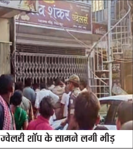
ज्वेलरी शॉप के सामने लगी गीड़

RAMGARH : रामगढ़ जिले के रजरप्पा थाना क्षेत्र अंतर्गत चितरपुर मोड़ के पास मंगलवार को दिनदहाड़े ज्वेलरी शॉप में लूट हो गई। शिवशंकर ज्वेलरी दुकान में करीब पांच अपराधियों ने लूटपाट की कोशिश की थी, लेकिन उसी दौरान स्थानीय लोगों और दुकानदार की सतर्कता से घटना टल गई। लोगों ने दो अपराधियों को पकड़ लिया, जबकि तीन आरोपी भारी मात्रा में गहने लेकर भाग गए। गुस्साए लोगों ने दोनों को पीटकर घायल कर दिया। सूचना मिलते ही पुलिस पहुंची और स्थिति को नियंत्रित किया। घटनास्थल से एक पिस्तौल भी बरामद की गई है। घायल दोनों आरोपियों को पुलिस ने इलाज के लिए रामगढ़ सदर अस्पताल में भर्ती कराया है। रामगढ़ सदर अस्पताल के