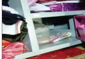
चोरी के बाद टूटी अलमारी