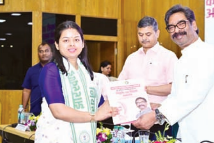
नियुक्ति पत्र सौंपते मुख्यमंत्री हेमंत सोरेन व अन्य