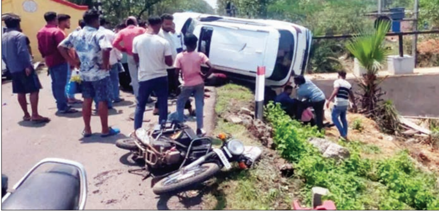
पलटी कार को सैधा करते लोग

PHOTON NEWS JSR: पूर्वी सिंहभूम जिले के पोटका थाना क्षेत्र में हाता के पास जुड़ी रेलवे फाटक के पास मंगलवार को एक तेज रफ्तार कार हादसे का शिकार हो गई। झाड़ग्राम (पश्चिम बंगाल) से रायरंगपुर (ओडिशा) जा रही इस कार ने पहले फाटक के बंपर को टक्कर मारी। इसके बाद बेकाबू कार टाटा मैजिक पिकअप वैन से टकरा गई। यही नहीं, कार ने दो बाइकों को भी अपनी चपेट में ले लिया। इस हादसे में टाटा मैजिक और बाइक सवार कुल 11 लोग गंभीर रूप से घायल हो गए। जबकि, एक व्यक्ति की घटनास्थल और एक की अस्पताल में मौत हो गई। बताते हैं कि झाड़ग्राम से एक ही परिवार के लोग शादी समारोह में शामिल होने कार से रायरंगपुर जा रहे थे। जुड़ी रेलवे फाटक के पास