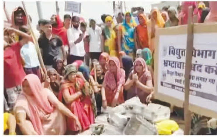
smart meter rollout in Uttar Pradesh into a policy that is generating more heat than light.

smart meter rollout in Uttar Pradesh into a policy that is generating more heat than light. The controversy comes even as the north is bracing for a harsh summer with the mercury inching up with every passing day.