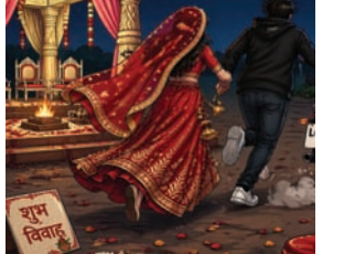
● बनने से पहले टूट गया रिश्ता, फिल्मी अंदाज में दुल्हन ने सबको चौंकाया