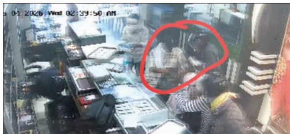
सीसीटीवी फुटेज में दिख रहे अपराधी