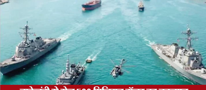
नाकेबंदी से रोज 500 मिलियन डॉलर का नुकसान

सीजफायर बढ़ाए जाने के बीच ईरान की इस्लामिक रिवायूशनरी गार्ड फोर्स (आईआरजीसी) ने सख्त बयान जारी किया है। आईआरजीसी ने कहा है कि इलाके में तनाव बढ़ रहा है, इसलिए उनकी सेना पूरी तरह सतर्क है। उन्होंने चेतावनी दी कि अगर कोई हमला हुआ, तो वे बहुत जोरदार जवाब देंगे। इसी बीच आईआरजीसी ने ओमान के तट के पास एक कंटेनर जहाज पर फायरिंग की। उसका दावा है कि जहाज ने चेतावनी को नजरअंदाज किया था।