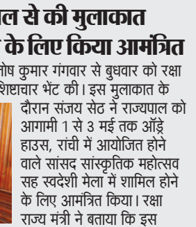
राज्यपाल से की मुलाकात

RANCHI : झारखंड के राज्यपाल संतोष कुमार गंगवार से बुधवार को रक्षा राज्य मंत्री संजय सेठ ने लोक भवन में शिरावार भेंट की। इस मुलाकात के दौरान संजय सेठ ने राज्यपाल को आगामी 1 से 3 मई तक ऑइं हाउस, रांची में आयोजित होने वाले सांसद सांस्कृतिक महोत्सव सह स्वदेशी मेला में शामिल होने के लिए आमंत्रित किया। रक्षा राज्य मंत्री ने बताया कि इस आयोजन का मुख्य उद्देश्य स्थानीय कला, संस्कृति और स्वदेशी उत्पादों को बढ़ावा देना है। उन्होंने कहा कि ऐसे कार्यक्रमों के माध्यम से स्थानीय कलाकारों और कारीगरों को अपनी प्रतिभा प्रदर्शित करने का मौक मिलता है, जिससे उनकी पहचान बढ़ती है और उनकी आजीविका को भी मजबूती मिलती है। उन्होंने उम्मीद जताई कि इस महोत्सव के जरिए स्वदेशी उत्पादों को प्रोत्साहन मिलेगा और क्षेत्रीय सांस्कृतिक विरासत को नई पहचान मिलेगी।