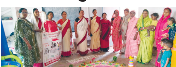
पोषण पखवाड़े में भाग लेती महिला पर्यवेक्षिकाएं व अन्य

पोषण पखवाड़ा की सफलता को ले बुधवार को नवादा जिले के स्कूलों में जागरूकता मेला आयोजित की गई, जिसके बेहतर परिणाम दिख रहे हैं। नवादा जिले के नरहट प्रखंड में पोषण पखवाड़ा के अंतर्गत विभिन्न स्कूलों में जागरूकता मेला आयोजित किया गया। इस दौरान बच्चों को जंक फूड से दूर रहने और मोबाइल स्क्रीन के अत्यधिक उपयोग से होने वाले नुकसान के बारे में जानकारी दी गई। साथ ही संतुलित आहार और स्वस्थ जीवनशैली अपनाने के लिए प्रेरित किया गया। कार्यक्रम के दौरान महिलाओं को भी पोषण के महत्व के बारे में