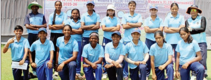
जमशेदपुर की टीम