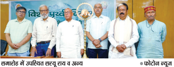
समारोह में उपस्थित सरयू राय व अन्य

PHOTON NEWS RANCHI : जमशेदपुर पश्चिम के विधायक सरयू राय ने कहा है कि सत्ता के शीर्ष पर बैठे लोगों की कार्य संस्कृति आज सवालियों के घेरे में है। धरती और पर्यावरण संरक्षण के बारे में आज आम आदमी से ज्यादा सत्ता के शीर्ष पर बैठे लोगों, मेधावी मस्तिष्क के स्वामियों और नौकरशाहों को जागरूक करने की आवश्यकता है। आम आदमी तो स्वयं भुक्तभोगी है। पुरानी विधानसभा के सभागृह में युगांतर भारती और नेचर फाउंडेशन के संयुक्त तत्वावधान में पृथ्वी दिवस पर आयोजित समारोह में सरयू राय ने कहा कि आज अस्पष्ट डेवलपमेंट के स्थान पर