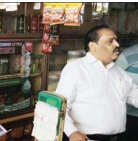
दुखेद प्रशासन ने आगे की कार्रवाई का खाका भी तैयार कर लिया है। जानकारी के अनुसार, 28 अप्रैल को बर्मागाईस क्षेत्र में अतिक्रमण हटाने का अभियान चलाया जाएगा, जिसके लिए संबंधित लोगों को पहले ही नोटिस जारी किया जा चुका है। कुल मिलाकर, गुदड़ी बाजार में कार्रवाई भले ही फिलहाल टल गई हो, लेकिन प्रशासन और रेलवे ने स्पष्ट संकेत दे दिए हैं कि अतिक्रमण के खिलाफ अभियान लगातार जारी रहेगा।