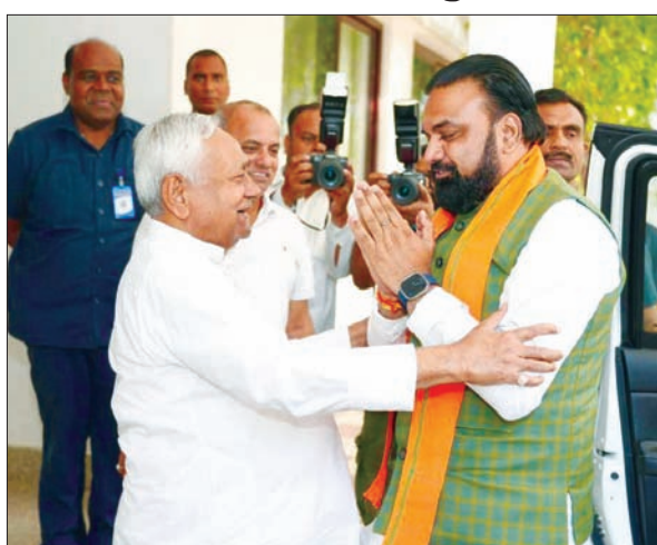
मुख्यालय का भी दौरा किया। जानकारी के अनुसार, भाजपा के राष्ट्रीय अध्यक्ष नितिन नवीन से भी उनकी दो बार मुलाकात हुई, जिसमें बिहार के राजनीतिक हालात और मंत्रिमंडल विस्तार पर चर्चा हुई। मुख्यमंत्री सम्राट

मुख्यमंत्री सम्राट चौधरी बुधवार को दो दिवसीय दिल्ली दौरे से पटना लौट आए हैं। पटना लौटने के बाद मुख्यमंत्री सम्राट चौधरी सबसे पहले पूर्व मुख्यमंत्री एवं जदयू के राष्ट्रीय अध्यक्ष नीतीश कुमार से मुलाकात की। नीतीश कुमार ने सम्राट का गर्मजोशी से स्वागत किया। दोनों की इस मुलाकात को बेहद खास माना जा रहा है। इसका बड़ा कारण बिहार मंत्रिमंडल का विस्तार है जिस पर सबकी नजर टिकी है। मुख्यमंत्री सम्राट चौधरी ने मंगलवार को दिल्ली का दौरा किया है। उन्होंने प्रधानमंत्री नरेन्द्र मोदी से मुलाकात की और संगठनात्मक स्तर पर भी सक्रिय रहे। मंगलवार को उन्होंने भाजपा के वरिष्ठ नेता जेपी नड्डा समेत कई नेताओं से बातचीत की। वहीं, दिल्ली में उन्होंने आरएसएस