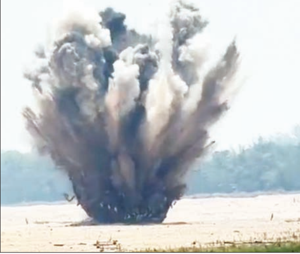
नदी के किनारे धमाके के दौरान उठा युवा

बुधवार को दोपहर में सेना के विशेषज्ञों ने एक विशेष रणनीति के तहत इस बम को डिस्ट्रॉय किया। सेना के अधिकारियों ने बताया कि यह बम यूएसए एएनएम 64 बम है। इसे अमेरिका में तैयार किया गया था। आमतौर से इसे अमेरिकी नौसेना प्रयोग करती है। अधिकारियों का कहना है कि नियंत्रित विस्फोट