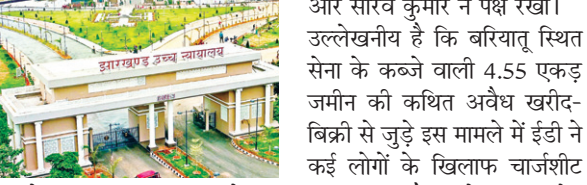
घोटाले का मामला