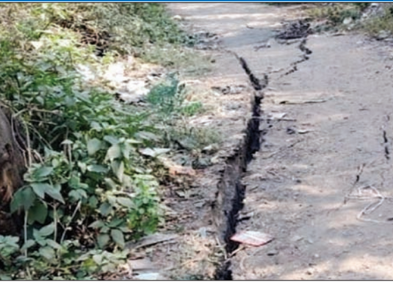
जमीन पर पड़ी ट्रेलर

मौत हो गई थी। लोगों ने फोरलेन सड़क को जाम कर विरोध जताया था। अभी भी करीब 12 परिवार खुले आसमान के नीचे रह रहे हैं।